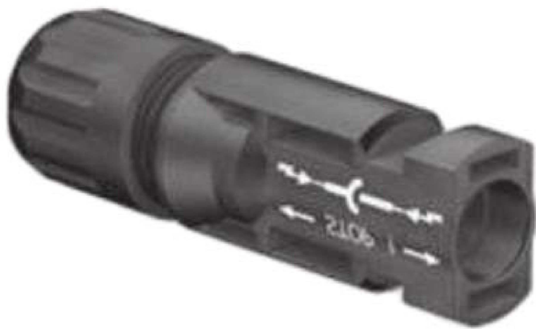
PV Modul MC4 Buchse (-)