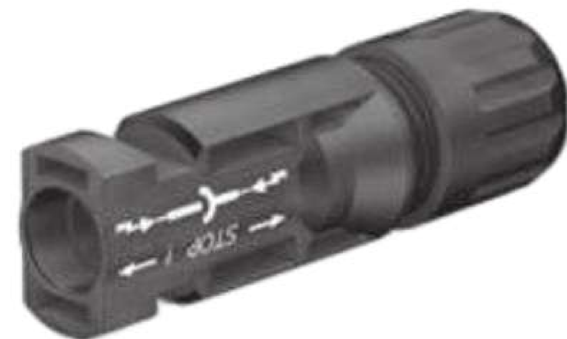
Wechselrichter MC4 Stecker