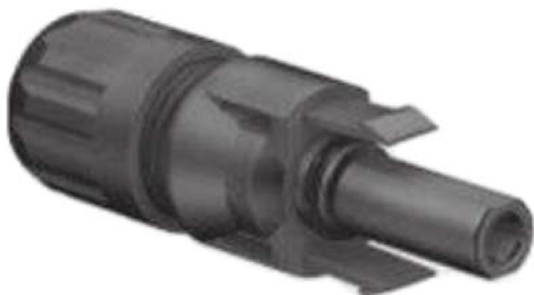
PV Modul MC4 Buchse (-)