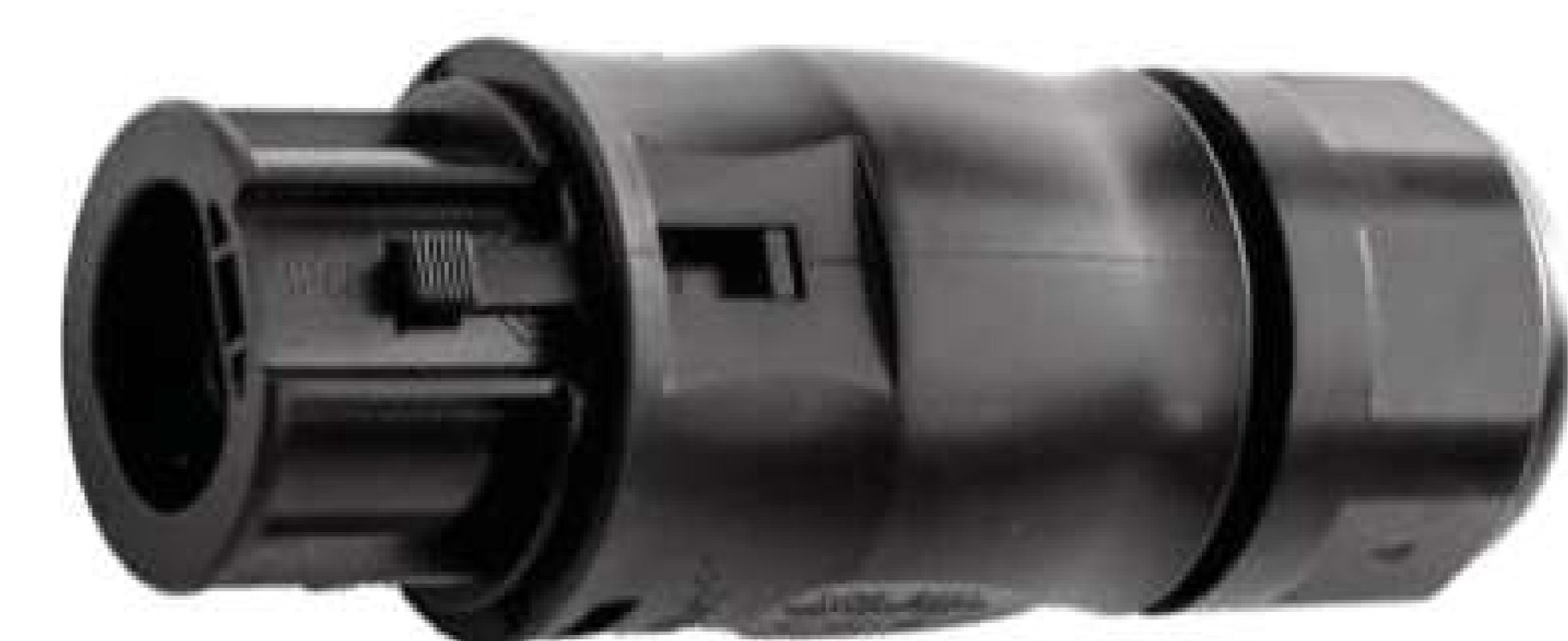
AC Anschluss Wechselrichter (Stecker)