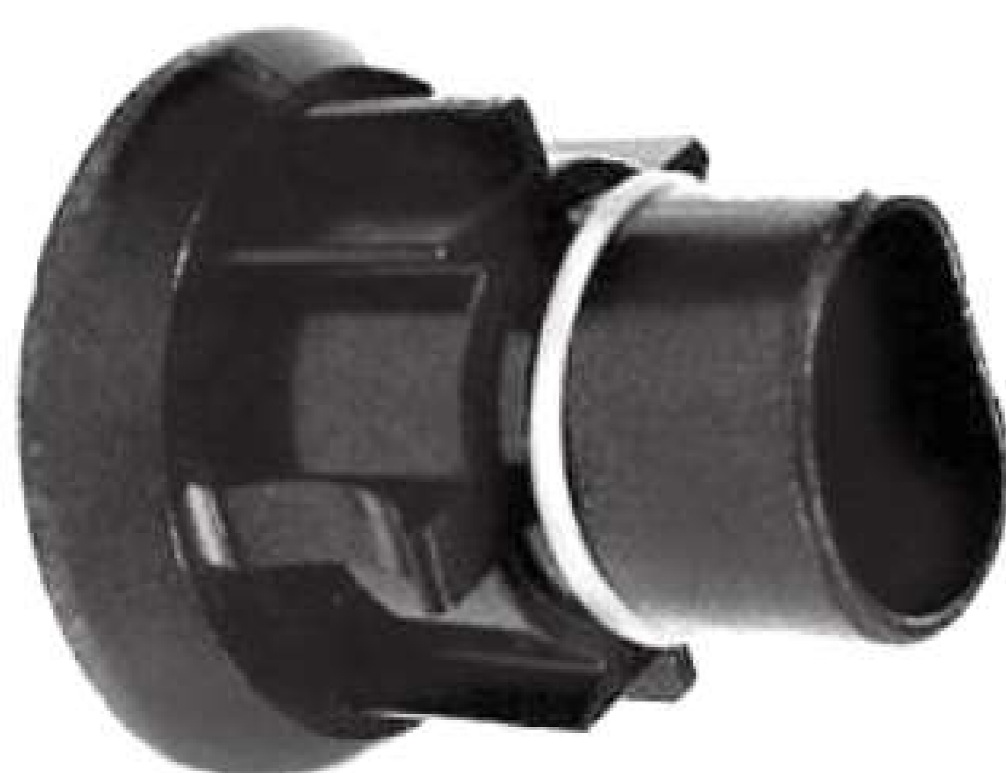
AC Buchse Verlängerungskabel (optional)