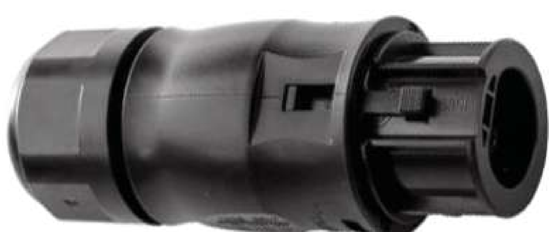
AC Buchse Verlängerungskabel (optional)